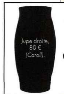
Jupe droite, 80 € (Caroll).