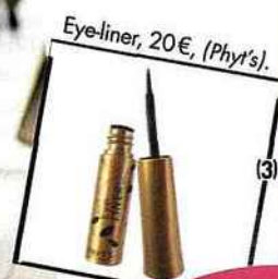
Eye-liner, 20 €, (Phyt's).